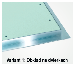
Variant 1: Obklad na dvierkach