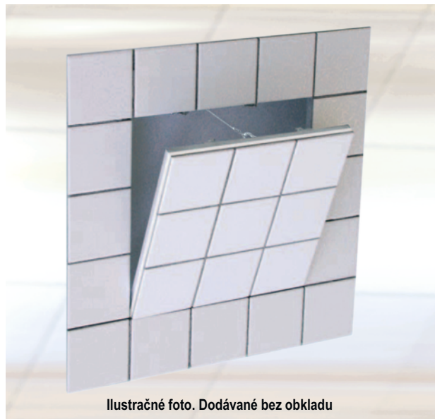
Ilustračné foto. Dodávané bez obkladu

Odnímateľné krídlo dvierok je od veľkosti 300 x 300 mm vybavené poistným úchytom Aby sa zabránilo prípadným úrazom, po každom otvorení dvierok sa úchyt musí znovu zaistiť. Medzi rámom a krídlom dvierok je vzduchová medzera 1,75 mm, ktorá je po obvode vyplnená tesnením. Dvierka sa otvárajú stlačením neviditeľných zacvakávacích zámkov.