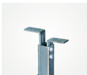
Stropné pripojenie: Variant B: s uholníkmi