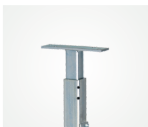
Stropné pripojenie: Variant A: s teleskopickou rúrou