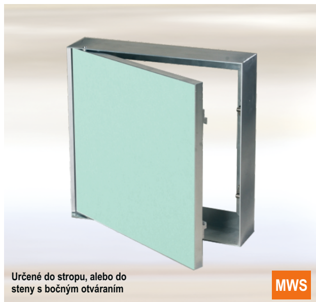
Určené do stropu, alebo do steny s bočným otváraním