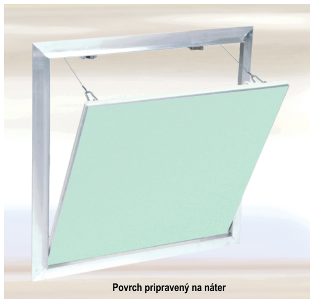
Povrch pripravený na náter

Dostupné aj v skrutkovanej verzii, alebo ako rám bez výplne.