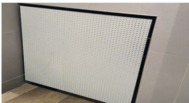
Využitelné napr. ako kryt radiátora s použitím perforovanej výplne

Na pranie môžu byť zhotovené rôzne atypické veľkosti.